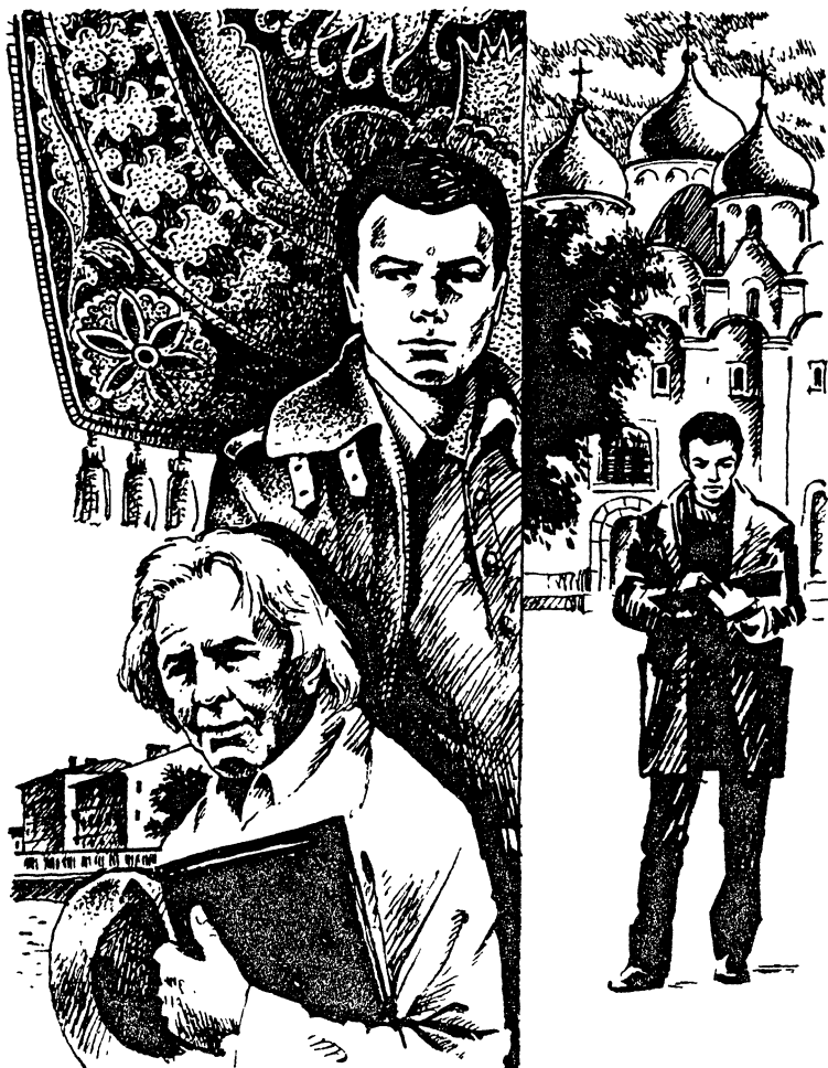
Рис В Родина

— А на столе вы не заметили никаких предметов?